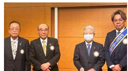
ポールハリスフェロー